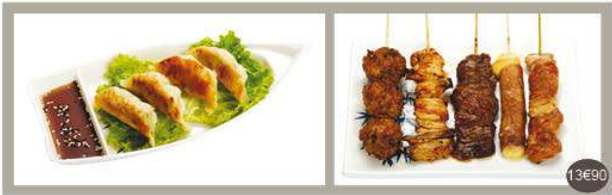
Menu 7 Soupe, salade, riz, 4 raviolis grillés, 5 brochettes : 1 poulet, 1 ailes de poulet, 1 boulettes de poulet, 1 bœuf, 1 bœuf au fromage,