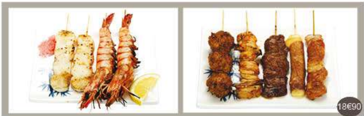
Menu 9 Soupe, salade, riz, 9 brochettes : 1 poulet, 1 ailes de poulet, 1 boulettes de poulet, 1 bœuf, 1 bœuf au fromage, 2 coquilles St-Jacques, 2 gambas