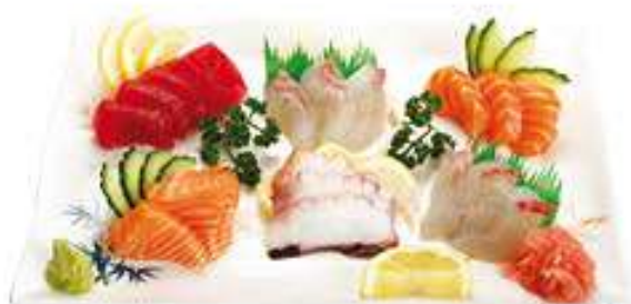
Menu A Soupe, salade, riz, 10 sashimi assortis