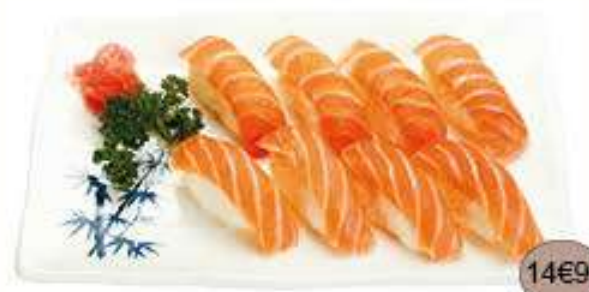
Menu G Soupe, salade, 8 sushi saumon