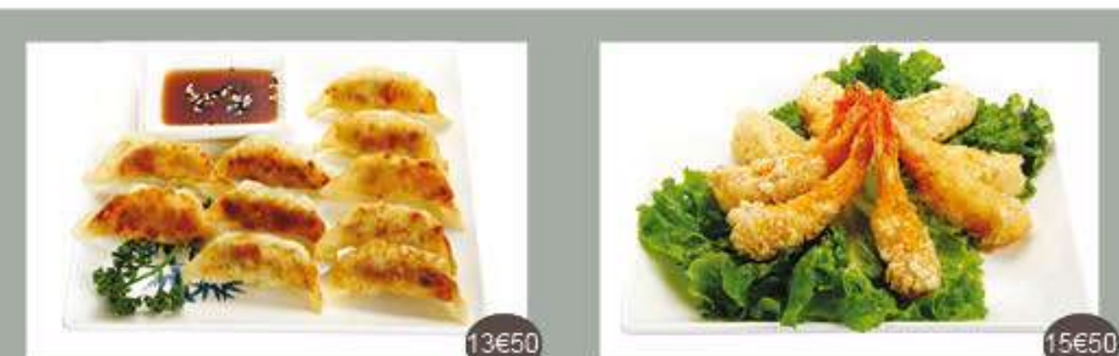
Menu 10 Soupe, salade, riz, 10 raviolis grillés